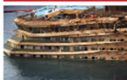
FOTO: ZAVRŠEN POTHVAT IZVLAČENJE COSTE OLUPINE Concordia napokon na površini

Olupina je teška 114.500 tona i duga poput tri nogometna igrališta